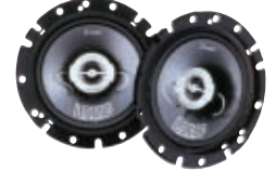
SR-1610C 16cmコアキシャル2ウェイスピーカー (2個1組) 希望小売価格 18,800円 (税別)

●使用ユニット:ウーファー16cmP.P (ハイブリッドマイカ) コーン、ツイーター2.5cmPPTAコーン ●ピークパワー:140W ●再生周波数帯域:30~50,000Hz ●外形寸法 (W×H×Dmm):φ164×58mm (埋込量45) ●質量:0.85kg (1個)