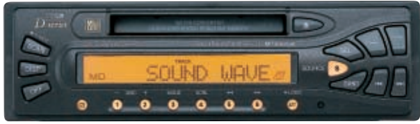
MD-H555LP MDセンターユニット 希望小売価格 38,000円 (税別)