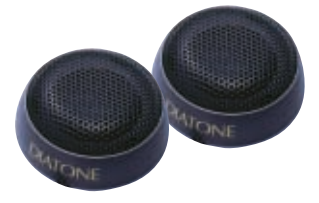
SG-25TW-S 25mmソフトドームトウィーター 希望小売価格 12,800円 (税別) PEAK 150W

●スピーカー方式:25mmソフトドーム形トウィーター ●インピーダンス:4Ω ●定格入力:35W ●瞬間最大入力:150W ●出力音圧レベル:86dB±2dB ●再生周波数帯域:3,500~30,000Hz ●外形寸法 (W×H×Dmm):φ45×19 ●質量:70g (1個)