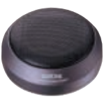
SX-60CT センタースピーカー 希望小売価格 9,800円 (税別) PEAK 20W

●ドルビーデジタル5.1chサラウンド対応・専用センタースピーカー。●最大入力20W・口径6cmのコンパクトタイプで、DVDサウンドをクリアに再生。●運転中の視界を妨げず、ベストポジションに設置可能な薄型デザイン採用。