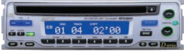
CD-H55MP CDセンターユニット 希望小売価格 49,800円 (税別)

MP3対応・CDセンターユニット。 オリジナル編集のCD-R/RWが、クルマの中でも楽しめる。