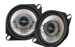
SR-1098C 10cmコアキシャル2ウェイスピーカー (2個1組) 希望小売価格 14,800円 (税別) 在庫僅少

●使用ユニット:ウーファー10cmP.P (ハイブリッドマイカ) コーン、ツイーター2.5cmポリエステルコーン (バランストーム型) ●ピークパワー:80W ●再生周波数帯域:45~25,000Hz ●外形寸法 (W×H×Dmm):φ102×47 (埋込量36) ●質量:0.45kg (1個)